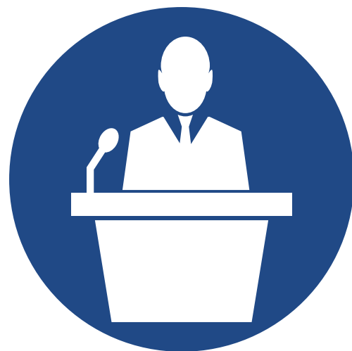
Gale i debaty